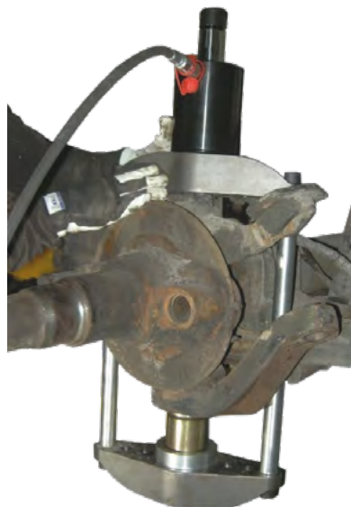
Aufbausatz für BPW & SAF Kingpin-/Achsschenbolzen