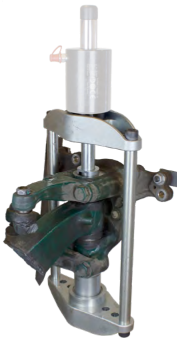
Universalsatz zum Auswechseln von Kingpin/Achsschenbolzen

Weitere Zubehörsätze für z. B. Mercedes und MAN erhältlich!