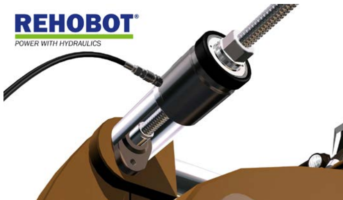
Einsatz Hohlkolbenzylinder 37to beim Austausch einer Buchse an einer Baumaschine

Für schwere Arbeiten an Nutzfahrzeugen, die optimal mit hydraulischen Werkzeugen unterstützt und vereinfacht werden können, vertritt JOSAM die Produkte des schwedischen Herstellers REHOBOT (ehemals NIKE). Neben einer großen Bandbreite von Hydraulikpumpen und -zylindern sind neue Einsatzmöglichkeiten mit Hohlkolbenzylindern (6-57to) erwähnenswert. Für die gängigsten 18to Hohlkolbenzylindersätze werden neue Anwendungen zum Ein- und Auspressen von Buchsen und Lagern an Aufliegerachsen und LKW-Stabilisatoren vorgestellt.