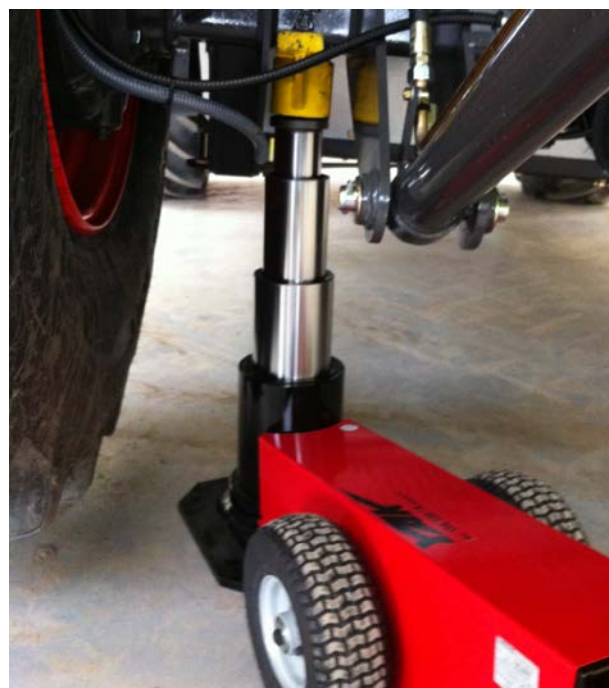
YAK 330 mit 3-fach Teleskopzylinder und sensationellem 525mm Hub

Last but not least greift JOSAM Richttechnik GmbH zusätzlich zur Optimierungen anfallender Arbeiten auch bei der Organisation in Ihrer Werkstatt unter die Arme. Mit den INDECO Ordnungssystemen gewinnt Ihre Werkstatt eine platz sparende und individuelle Lösung und die große Menge verschiedener Werkzeuge lässt sich schnell auffindbar und übersichtlich lagern. Namhafte Automobilhersteller wie Daimler und auch die Landtechnik Spezialisten Claas setzen auf diese professionelle Lösung und schätzen die ausgearbeiteten und erprobten Lösungen mit langer Lebensdauer, die die Suche nach Werkzeugen minimieren und so bares Geld sparen.