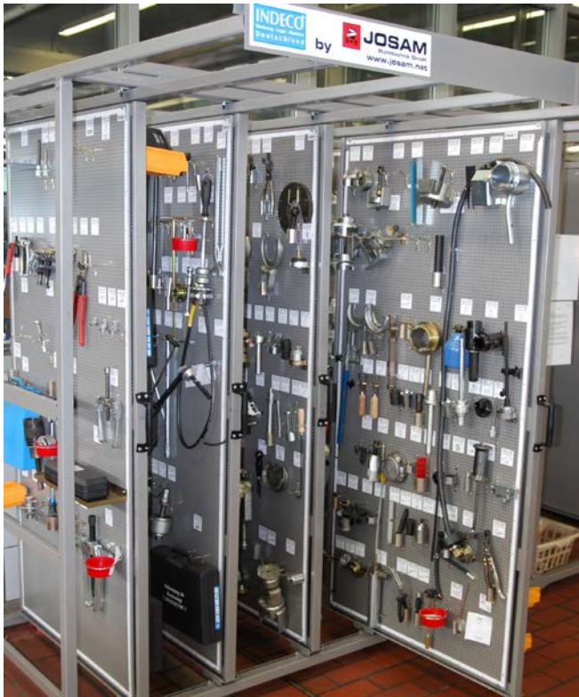
INDECO Bestückung für Spezialwerkzeuge

von ca. 400kg oder aber mit 5 Auszügen und einer Tragfähigkeit bis zu 700kg als Basis dienen. Insgesamt gewinnen Sie bei einer Stellfläche von 1,45qm (3 Auszüge) eine Lagerfläche von 12qm oder aber bei der größeren Variante mit 5 Auszügen und 2,6qm Stellfläche eine Lagerfläche von 20qm für Ihr Werkzeug.