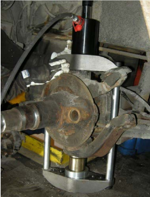
Wallmek Universalsatz zum Auswechseln von Achsschenkelbolzen