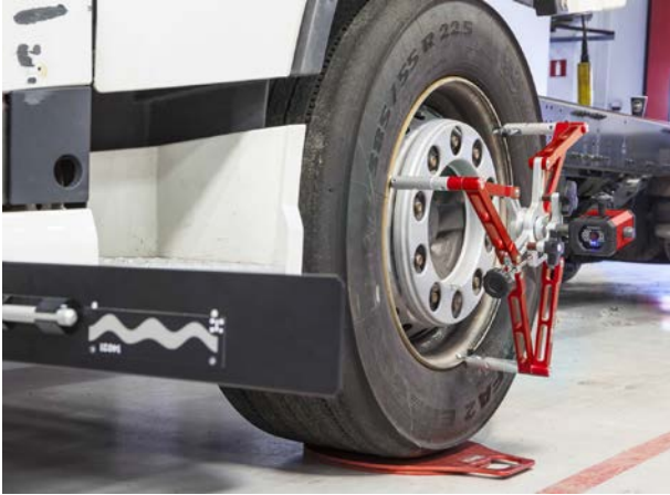
JOSAM cam-aligner: Achsvermessung für Nutzfahrzeuge mit Kamertechnologie

Dieses Jahr startet die NUFAM in Karlsruhe unter dem Motto „Get things moving“. Mit diesem Leitsatz kann sich JOSAM Richttechnik GmbH gut identifizieren, denn die Werkstattausrüster verbessern seit bald 40 Jahren Arbeitsprozesse und Rentabilität in NFZ-Werkstätten. Vom 26. bis 29. September 2019 präsentiert das Unternehmen in Halle 1 auf Stand C110 die aktuellen und von diversen Herstellern empfohlenen Achsmessgeräte. Damit lassen sich Nutzfahrzeuge in wenigen Minuten vermessen. Weitere Profi-Tools über die die NFZ-Spezialisten auf der NUFAM informieren sind: