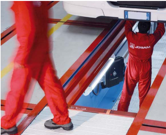
ASP Grubenabdeckung: Rutschfeste Tragbalken aus Aluminium für langlebige Qualität & viele Einsatzvarianten