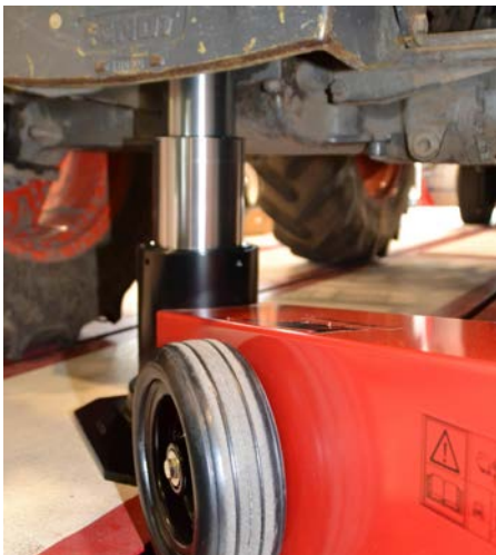
YAK Wagenheber 330/N mit maximalem Hub von 525mm