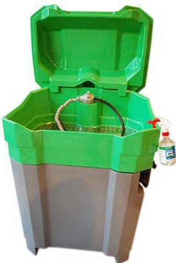
Umweltschützende Waschanlage entfernt Harze, Öle und Fette

Verbesserte Ordnung und leichtere Arbeitsmöglichkeiten schaffen die äußerst stabilen Schlauchaufroller. JOSAM Richttechnik GmbH präsentiert ein breites Sortiment an Aufrolltrommeln für alle Anwendungen mit Wasser, Strom und Luft von Ecodora, einem der führenden Hersteller in Europa. Nachhaltige Lösungen für manuelle oder automatische Bedienung.