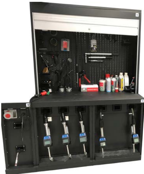
Technische Werkstattmöbel von Filcar

Verunfallte und beschädigte Fahrzeuge lassen sich oftmals schnell und kostengünstig wieder instand setzen. JOSAM Richttechnik GmbH bietet dafür unterschiedliche Richtanlagen an, die z.B. Rahmenverdrehrungen und Fahrerhäuser wieder „gerade rücken“. Umfangreiches Zubehör wie z.B. die Press- & Nietbügel, Induktionserhitzer, und Richttürme ermöglichen auch aufwändige Richtarbeiten. Die Ausfallzeiten der Fahrzeuge werden minimiert und das NFZ kann schnell wieder auf der Straße. Dabei kostet das Richten meist deutlich weniger als der Ersatz des Leiterrahmens oder des Fahrerhauses.