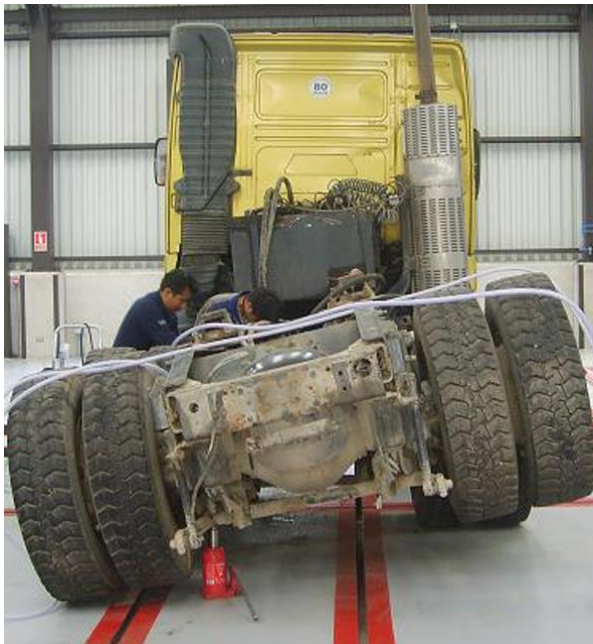
Unfallschaden – vor Instandsetzung

Der Fahrzeugrahmen ist das zentrale tragende Element eines Fahrgestells. Nach Unfällen sind die Rahmenprofile des Fahrzeugs meist verbogen – das heißt aber nicht, dass Ihr Nfz nun ein schadhafter Unfallwagen ist. Im umfangreichen Angebot an universellen Richtsystemen aus dem Hause JOSAM findet jede Werkstatt für sich das passende Produkt für kleine bis sehr aufwendige Richtarbeiten.