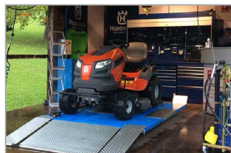
Foto: Erfolgreiche Präsentation unserer Werkstatteinrichtungen auf den Husqvarna-Powertagen.

Synergieeffekte nutzen für eine starke Partnerschaft: JOSAM Richttechnik GmbH ist ab sofort Kooperationspartner von Husqvarna in Bezug auf Werkstattausrüstung. Diese Zusammenarbeit präsentieren wir auf unserem Messestand auf der Agritechnica in Hannover.