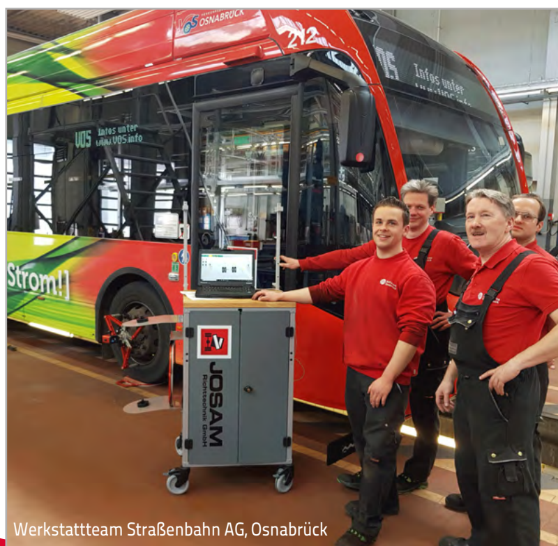
Werkstattteam Straßenbahn AG, Osnabrück